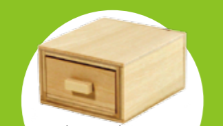
マジックボックス 中に入れた物が消えたりまた現れたりします！