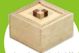
くるくるからくり箱 遠心力を利用したしかけです。くるくる回すと…？