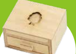
からくり変化 木の色が変化！します。すると…？