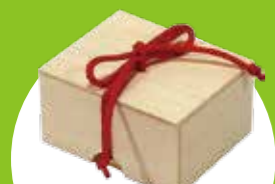
たまて箱 ひもがカギになっています。さて、どうしたら開くのかな？