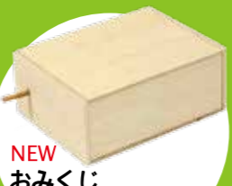
NEW おみくじ 当たりが出たら箱が開く！これで運だめし？