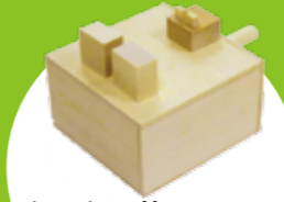
ケロケロ箱 開ける時「ケロケロ」と鳴く箱です。小ガエルがカギになっています。