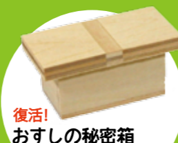
復活！おすしの秘密箱 開け方はシンプルですが最後に好きなネタを描いて楽しめます！