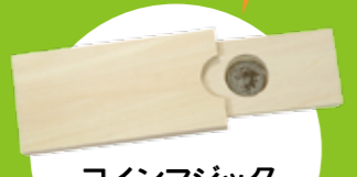
コインマジック コインが消える！これであなたもマジシャン？