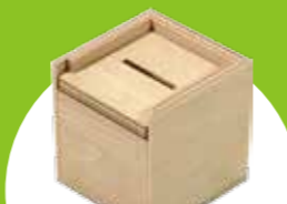
お金がたまる貯金箱 お金が1つばいにならないと開きません！