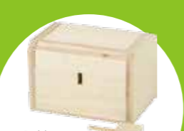
宝箱 カギを使って開けますがフタが意外な開き方をします。