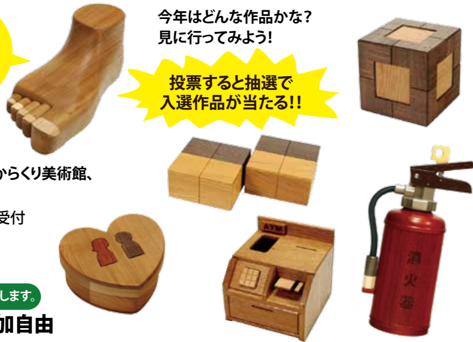
※写真は昨年の入賞作品。