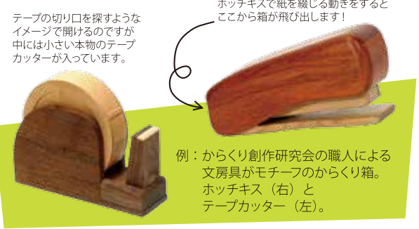
テープの切り口を探すようなイメージで開けるのですが中には小さい本物のテープカッターが入っています。

学校でも仕事でも家庭でも、身近にある様々な文房具。 そんな文房具の形をした「からくり箱」のアイデアを 大募集です！あなたの好きな文房具は何ですか？